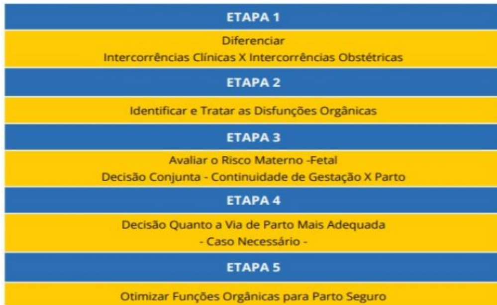
Figura 1. Etapas para tomada de decisão quanto à resolução de gravidez em gestante com Covid-19 grave (Fluxo próprio institucional)

O quadro 6 mostra as alterações da vitalidade fetal que podem levar à indicação de antecipação do parto: